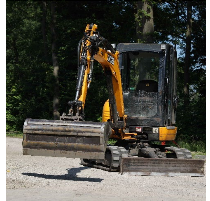
GROEN, GROND & INFRA